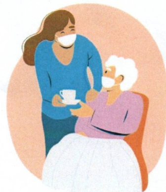
AIDE À LA TOILETTE ET AUX REPAS