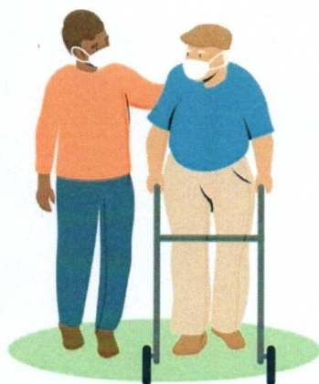
ACCOMPAGNEMENTS REGULIERS OU PONCTUELS/VÉHICULES OU AU BRAS