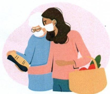
AIDE AUX COURSES

Un service d'aide et d'accompagnement dans votre quotidien encadré par une équipe d'intervenants formés, qualifiés et expérimentés.