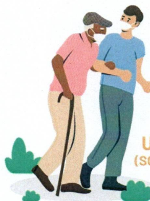
UNE COMPAGNIE (SORTIE, JEUX, LECTURE)